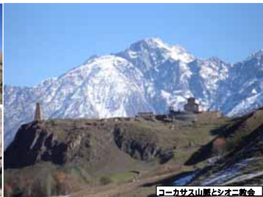
コーカサス山脈とシオニ教会