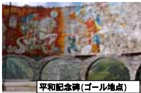
平和記念碑(ゴール地点)